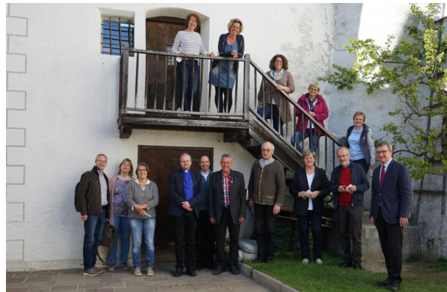
Gute Stimmung bei der Dekanatskonferenz im Juni 11