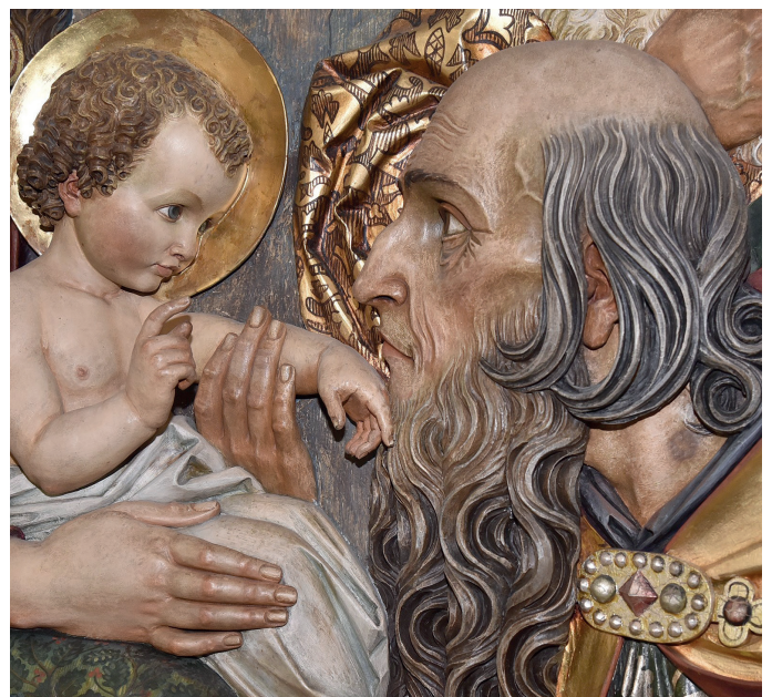
Detail aus dem Flügelaltar unserer Pfarrkirche