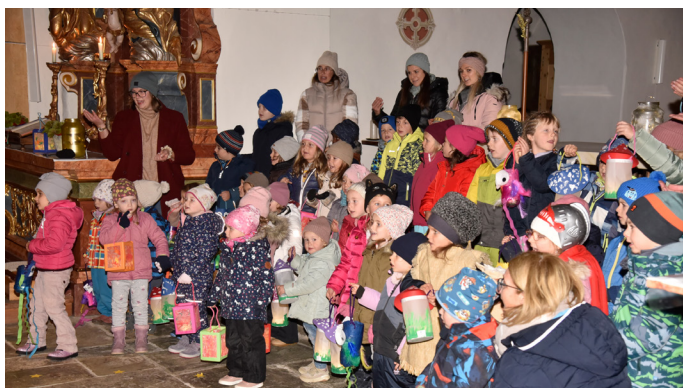
Fotostudio Roland Holitzky