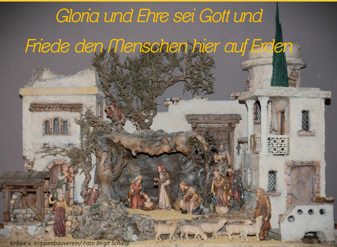
Krippe v. Krippenbauverein

Gloria und Ehre sei Gott und Friede den Menschen hier auf Erden