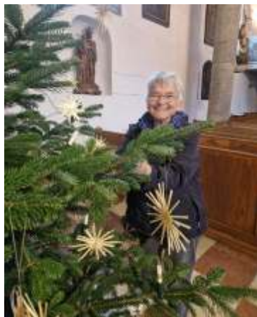
Kirche schmücken für Weihnachten