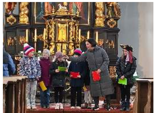
Vorstellung Erstkommunionkinder und Faschingsgottesdienst