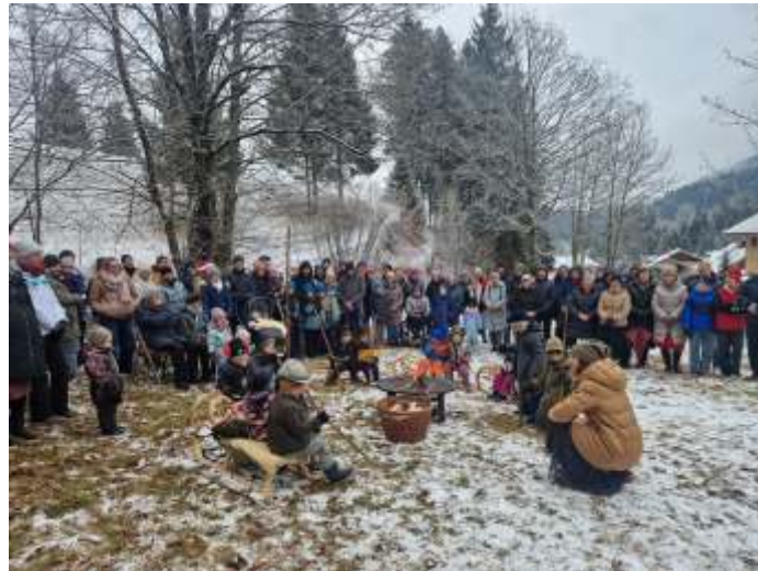
Andachten bei den Gmai